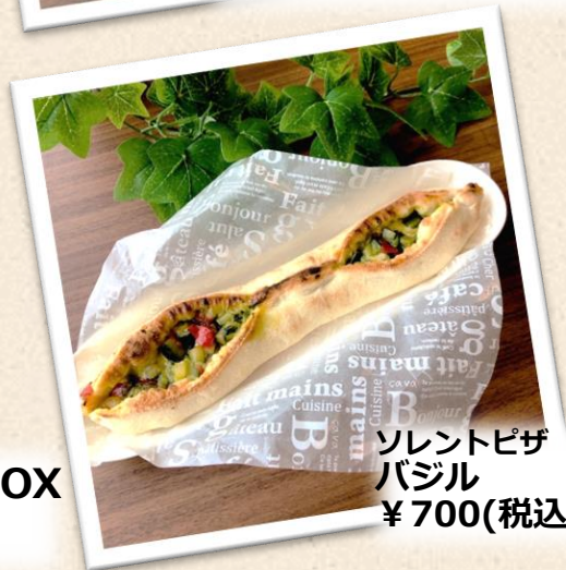
ソレントピザ バジル ¥700(税込)