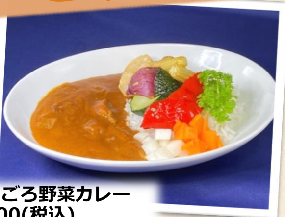
ごろごろ野菜カレー ¥800(税込)