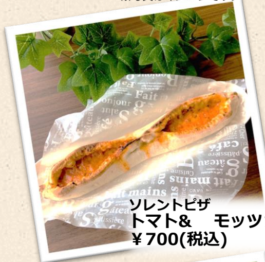
ソレントピザ トマト& モッツアレラ ¥700(税込)