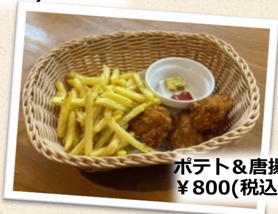
ポテト&唐揚げBOX ¥800(税込)